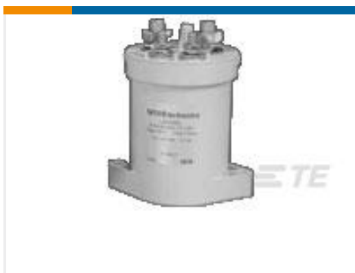
TE 产品编号1618387-7 LEV200A4NAA=RELAY, SPST-NO