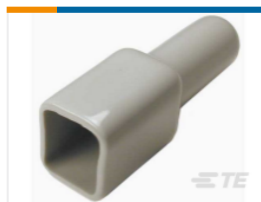
TE 产品编号DT4P-BT BOOT, 4P, REC, ST, GRY