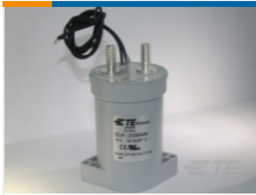
TE 产品编号 7-1618387-1 LEV200A5ANA=RELAY, SPST-NO