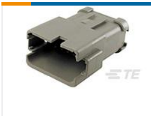
TE 产品编号DT04-12PA-P030 REC, 12P, GRY, BUSBAR 4X3, NICKEL, A