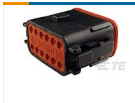
TE 产品编号DT06-12SB-CE06 PLG, 12P, BLK, E, SEAL RET, ENH KEY, B