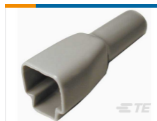
TE 产品编号DT4S-BT BOOT, 4P, PLG, ST, GRY