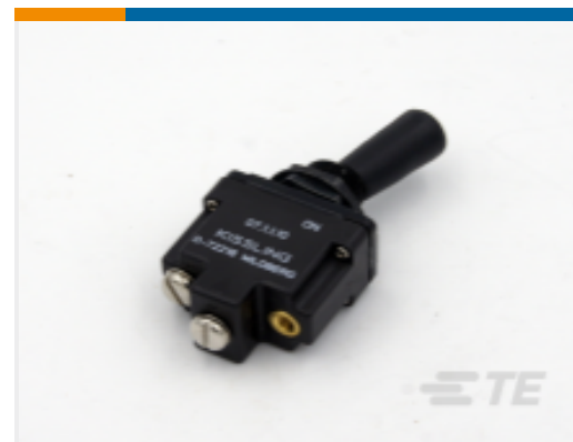
TE 产品编号K2015512 Toggle Switch 07-1-1-10