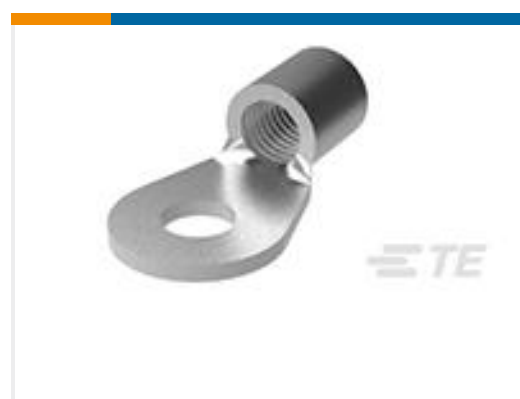
TE 产品编号35183 TERMINAL,SOLIS R 2 5/16