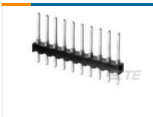
TE 产品编号1-87224-5 15 MODII HDR SRST UNSHRD .100