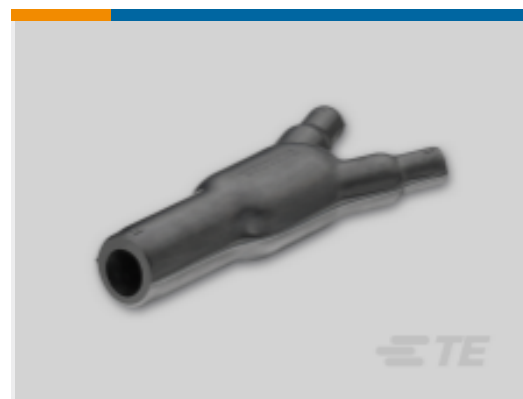
TE 产品编号163549-000 382A034-25/42-0