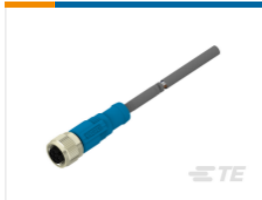
TE 产品编号T4161320008-004 M12 A-Code Pigtail, Female, Straight, Single End Cable