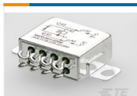
TE 产品编号 4-1617758-4 FCB-205-0219M=M83536/2-019M