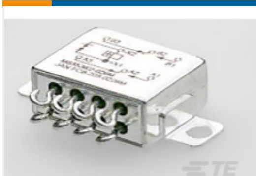
TE 产品编号 3-1617758-0 FCB-205-0122M=M83536/1-022M