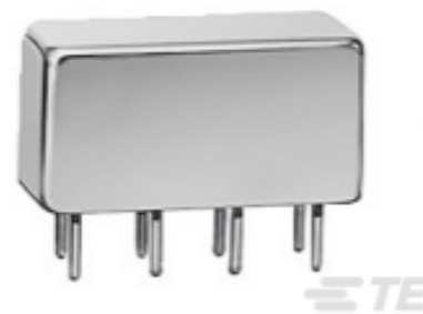
TE 产品编号3-1617536-2 HFW1230F01P=M39016/6-119P