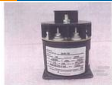
TE 产品编号1-1616037-6 DHR7B=CONTACTOR - 3PDT