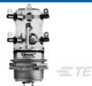
TE 产品编号1-1618273-5 H-16C=RELAY, VACUUM, DPDT