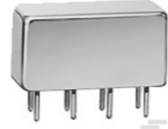
TE 产品编号3-1617536-2 HFW1230F01P=M39016/6-119P