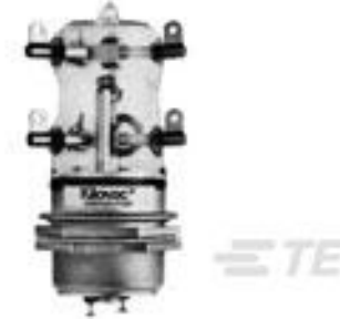
TE 产品编号1-1618273-5 H-16C=RELAY, VACUUM, DPDT