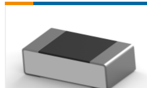
TE 产品编号 9-2176370-7 RQ 0603 4K32 0.1% 10PPM 5K RL