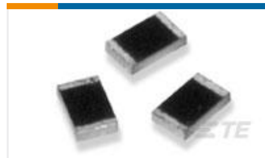
TE 产品编号 1-1879259-6 RP 2B 1K37 0.1% 15PPM CUT LENGTH