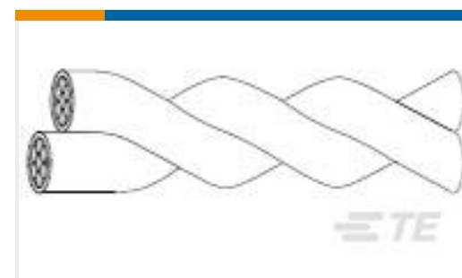
TE 产品编号 3832233001 44A0121-26-0/2