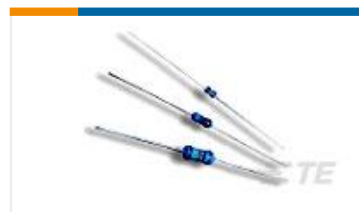
TE 产品编号 1622730-1 LR2 1% 30K