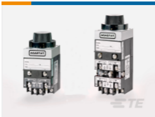
TE 产品编号 2-1423157-4 7012AK=RLY,STD,ON,2P,120VAC,30