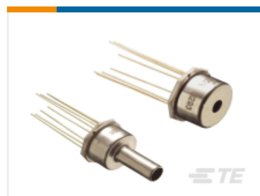
TE 产品编号17-015A 15PSIA BOARD MOUNT PRESSURE SENSOR