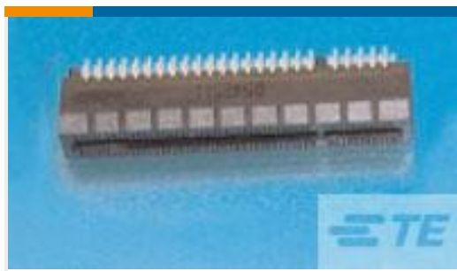
TE 产品编号1871058-3 PCI EXPRESS CONN. EON TYPE, 98