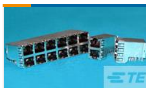
TE 产品编号6368035-4 2X6 OFFSET STK MJ,SHLD,G/Y LED&GND