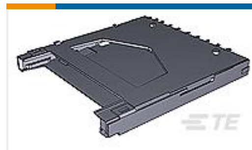
TE 产品编号1871916-1 SD RVS 0H EMBOSS ASSY