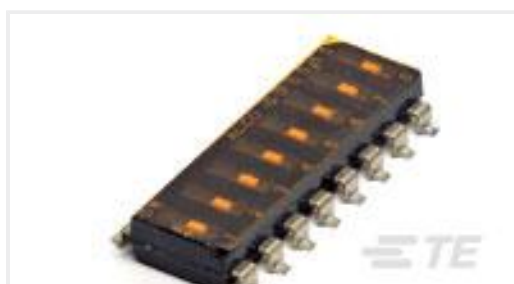
TE 产品编号1-1825006-9 GDS10S04=DIP SW,SLIDE,SMT