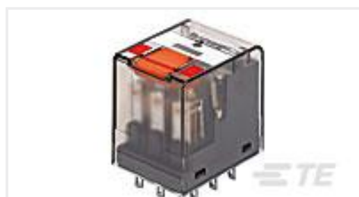
TE 产品编号3-1415020-1 PT570N20