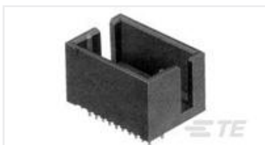
TE 产品编号5-104076-2 60 SYS50 HDR DRST SHRD W/SL SN