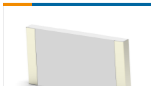
TE 产品编号7-2176246-6 CRGS2512 5% 1M8