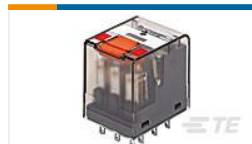
TE 产品编号3-1415020-1 PT570N20