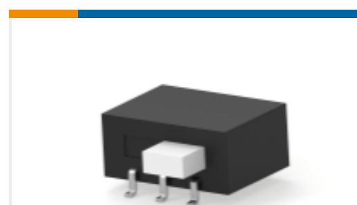
TE 产品编号1-1437581-1 ASE22RL=AUTOSLIDE DP