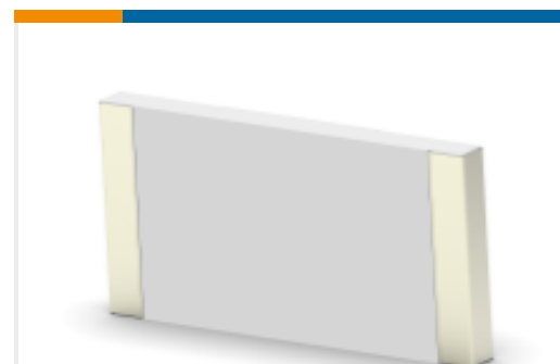
TE 产品编号7-2176246-6 CRGS2512 5% 1M8