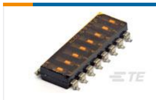
TE 产品编号1-1825006-9 GDS10S04=DIP SW,SLIDE,SMT