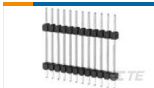
TE 产品编号 7-146460-5 25 MODII HDR SRST UNSHRD STKG