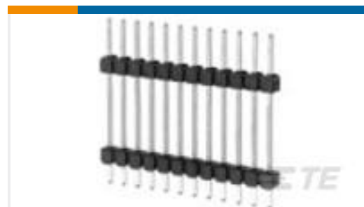
TE 产品编号 2-146460-5 25 MODII HDR SRST UNSHRD STKG