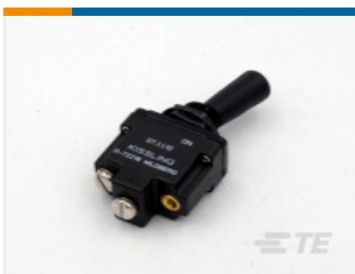
TE 产品编号K1007153 Toggle Switch 08-1-1-13