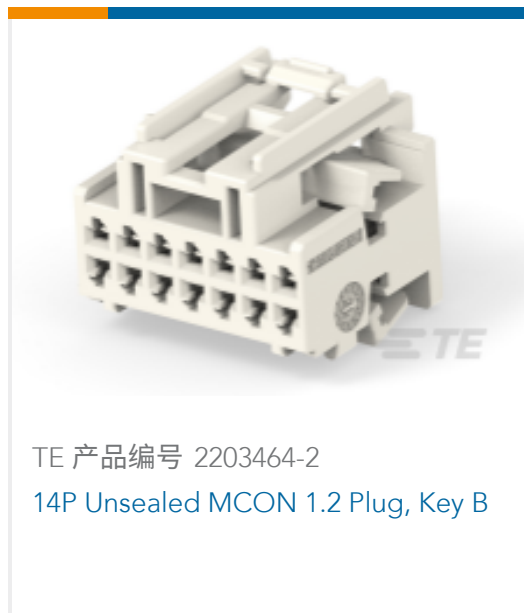
TE 产品编号 2203464-2 14P Unsealed MCON 1.2 Plug, Key B