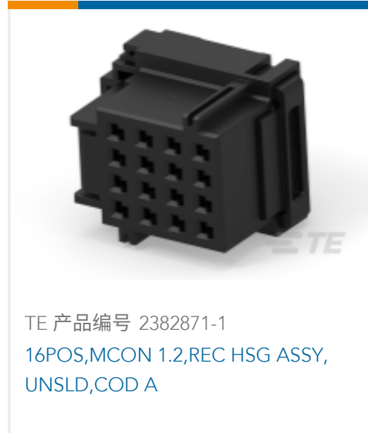
TE 产品编号 2382871-1 16POS, MCON 1.2, REC HSG ASSY, UNSLD, COD A