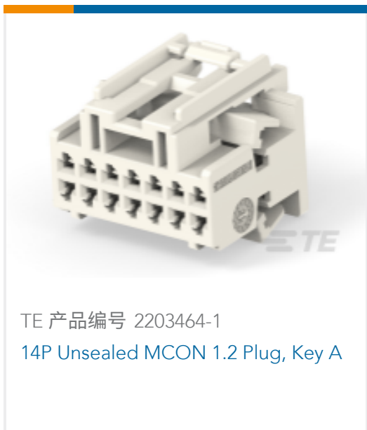
TE 产品编号 2203464-1 14P Unsealed MCON 1.2 Plug, Key A