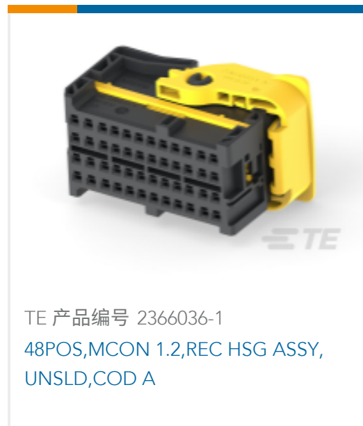
TE 产品编号 2366036-1 48POS, MCON 1.2, REC HSG ASSY, UNSLD, COD A