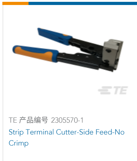
TE 产品编号 2305570-1 Strip Terminal Cutter-Side Feed-No Crimp