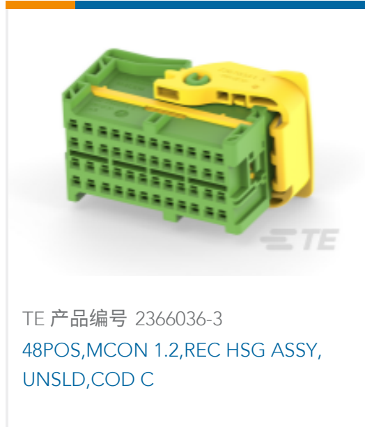
TE 产品编号 2366036-3 48POS, MCON 1.2, REC HSG ASSY, UNSLD, COD C