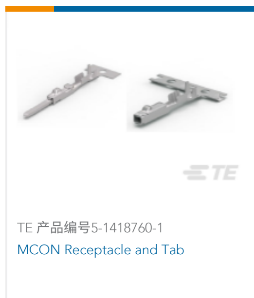
TE 产品编号 5-1418760-1 MCON Receptacle and Tab