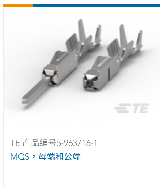
TE 产品编号 5-963716-1 MQS, 母端和公端