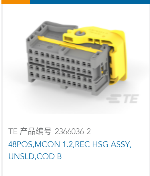
TE 产品编号 2366036-2 48POS, MCON 1.2, REC HSG ASSY, UNSLD, COD B