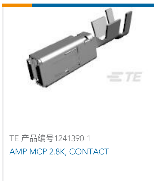
TE 产品编号 1241390-1 AMP MCP 2.8K, CONTACT