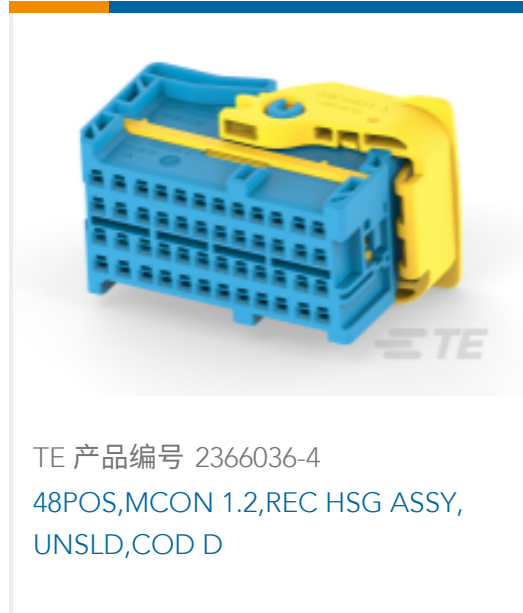
TE 产品编号 2366036-4 48POS, MCON 1.2, REC HSG ASSY, UNSLD, COD D