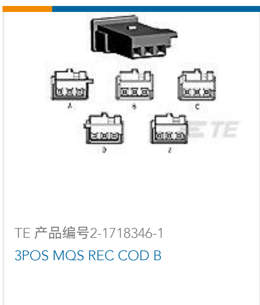
TE 产品编号 2-1718346-1 3POS MQS REC COD B