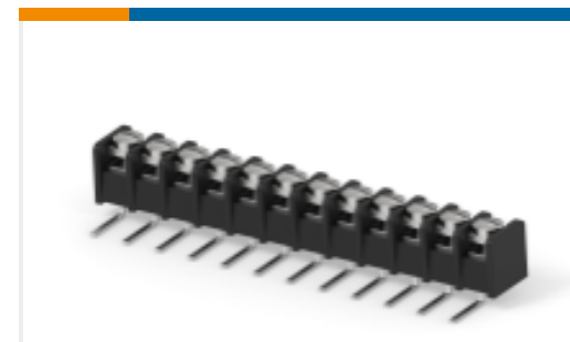
TE 产品编号1-1546462-2 4DB-R108-12=4DB ASSEMBLY