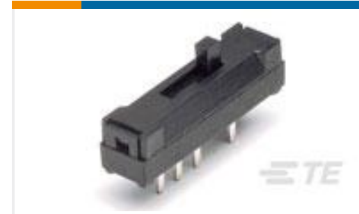
TE 产品编号1825282-1 SSJ12R04/SSJ91431F04=SPDT SLIDE SWITCH