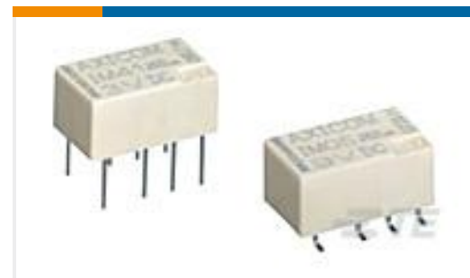
TE 产品编号3-1462039-8 IM06DTS=IM RELAY 140mW 12V