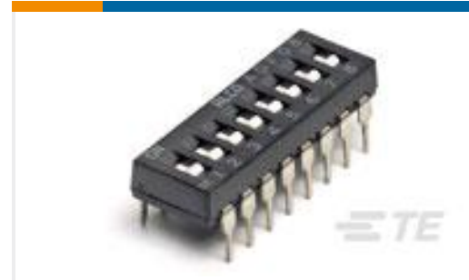
TE 产品编号1-1825002-7 ADF1004=DIP SWT,FLUSH,THRU/HL