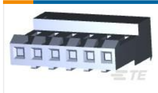
TE 产品编号3-640426-6 06P MTA156 CONN ASSY 18AWG ORA