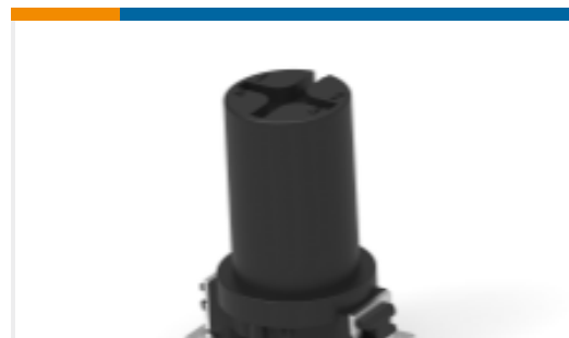
TE 产品编号474053-E M12 FEMALE, A CODE, 4P, 17MM SMT