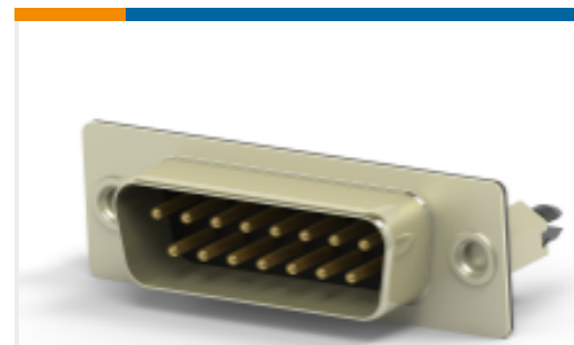
TE 产品编号2301828-1 AMPL PLUG HD20, VERT, 15P, B/L,4-40 INS