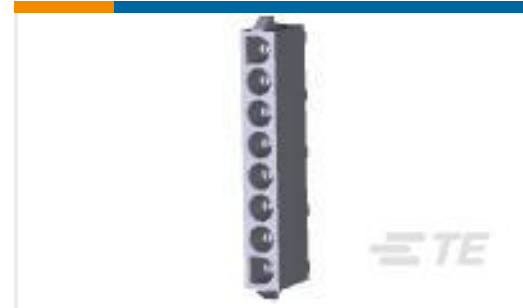
TE 产品编号643410-1 08P UMNL PIN HDR ASSY POL 94VO