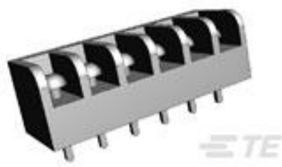
TE 产品编号 5-1437646-0 3PCV-06-006=#3 TRIBARRIER - CO