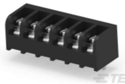
TE 产品编号 1546328-6 3PCV-06-304=.250 TRI BARRIER