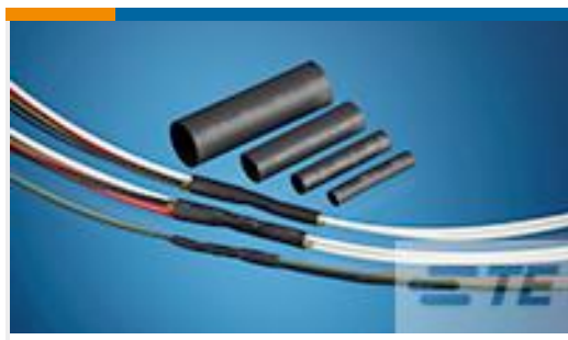
TE 产品编号5142422002 DSPL-NR4-0-STK