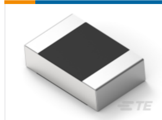
TE 产品编号6-1676731-4 RN 0805 13K3 0.1% 5PPM 1K RL