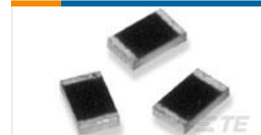
TE 产品编号3-1879267-8 RP 2B 909K 0.1% 15PPM 1K RL