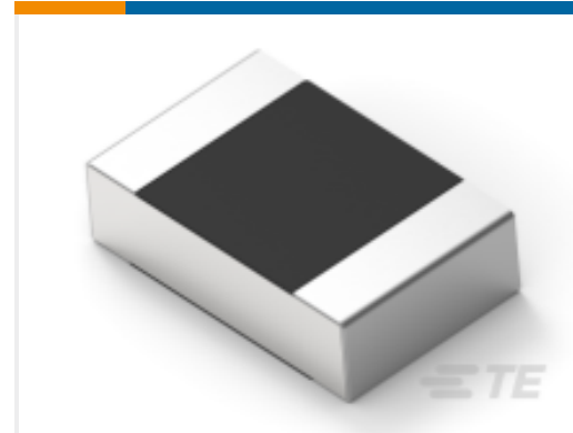
TE 产品编号6-1676731-3 RN 0805 31K6 0.1% 5PPM 1K RL