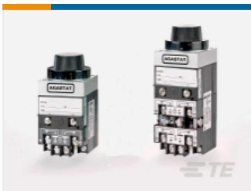
TE 产品编号 3-1423159-3 7012PJ=RLY,STD,ON,2P,125VDC,1