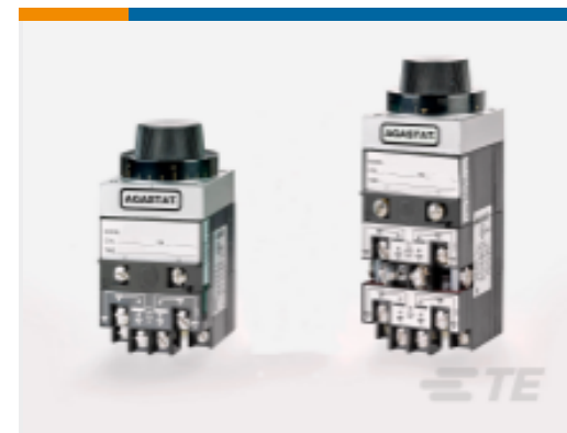
TE 产品编号 1755170-1 7022OCIM=RLY,STD,OFF,2P,24V,15S,I,M