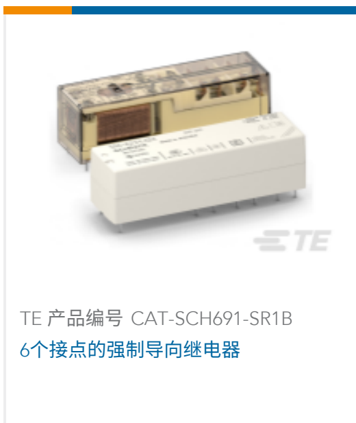
TE 产品编号 CAT-SCH691-SR1B 6个接点的强制导向继电器