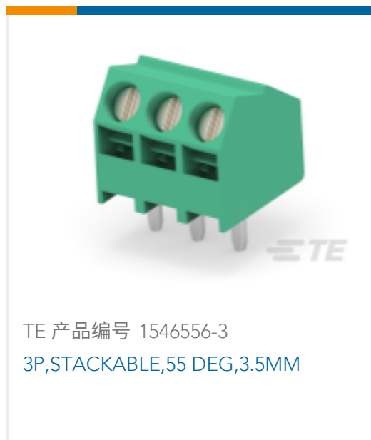
TE 产品编号 1546556-3 3P,STACKABLE,55 DEG,3.5MM