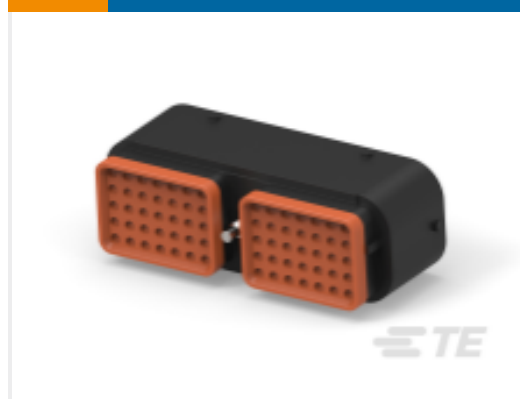
TE 产品编号DRC16-70SBE-P013UK PLG, 70P, BLK, E, SEAL BOND, B