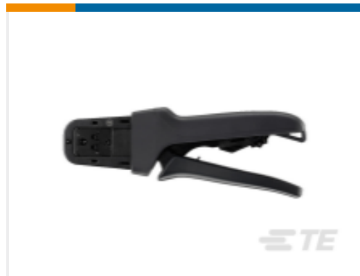
TE 产品编号DTT-20-03 CRIMP TOOL