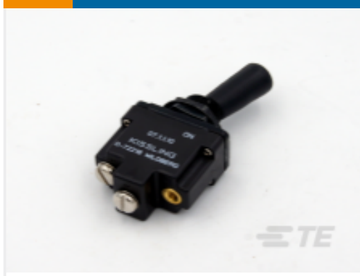
TE 产品编号K1007153 Toggle Switch 08-1-1-13