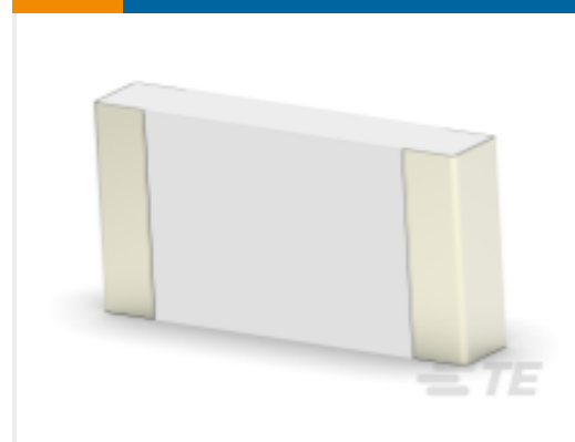
TE 产品编号2-2176245-2 CRGS1206 5% 56R