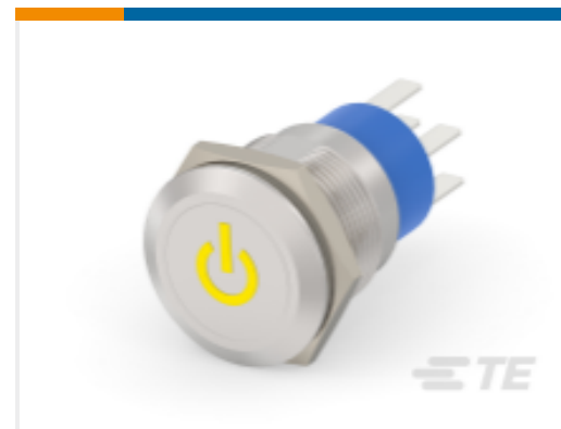
TE 产品编号 6-2213766-9 AV19 DPL 5A POWER LED YELLOW 12V