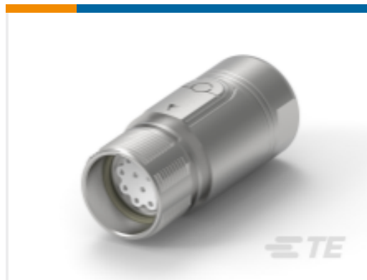
TE 产品编号 AKA012N00410100000 623 EXTENSION, SPEEDTEC