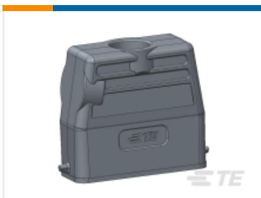
TE 产品编号 T1349160120-000 H16A-TGH-M20