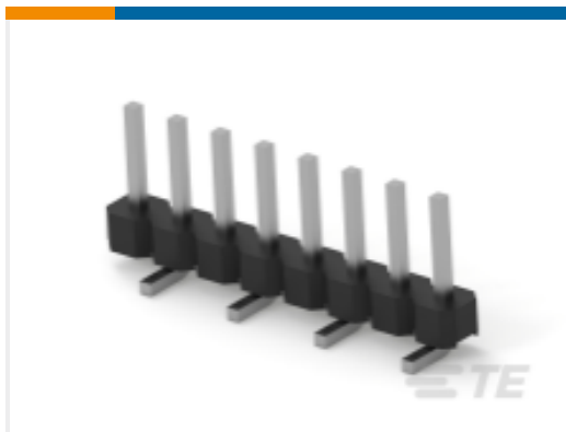
TE 产品编号 2842104-8 8P, 2MM, BRK HDR, SRVT, SMD, 0.76AU, TR W/CAP