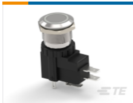
TE 产品编号 2-2364570-8 AVH19 FLT SS LK RNG R&B 24V16A