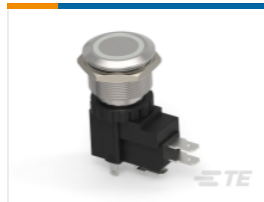
TE 产品编号 1-2364686-5 AVH22 FLT SS MT RNG GRN 24V16A