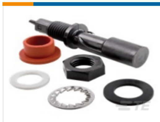
TE 产品编号 80645-000 LS809-51 Liquid Level Sensor