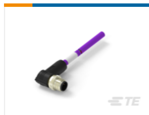
TE 产品编号TAB62246501-040 M12B2-MR-PUR TORSION-4.0M