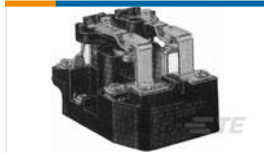
TE 产品编号1393127-9 PRD-11AG0-120=PRD