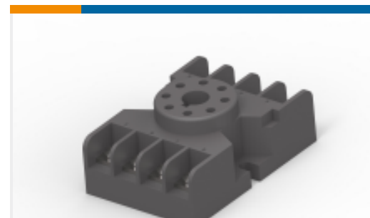
TE 产品编号1393143-6 27E122=SOCKET,KRP,8,SCW,PLES