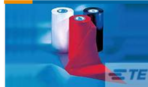
TE 产品编号742412-000 1330-0607-10