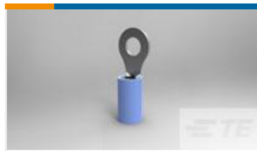
TE 产品编号51864-5 TERMINAL,PIDG R 16-14 8