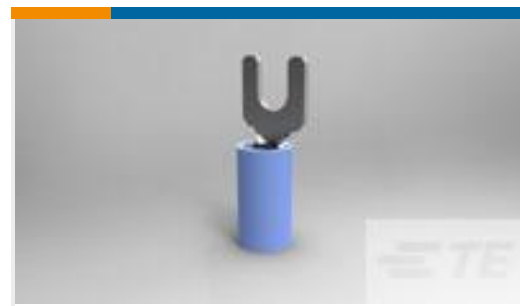
TE 产品编号1-328281-1 TERMINAL,PIDG SPD 16-14 6