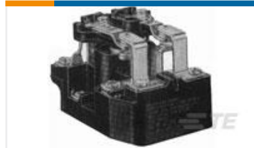
TE 产品编号6-1393127-2 PRD-11DY0-24=PRD-