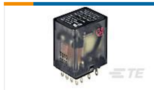
TE 产品编号5-1393122-5 KHAU-17D12-12=KH