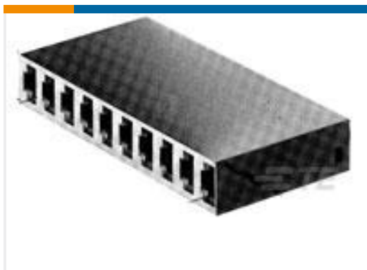
TE 产品编号1-87159-0 10 MODI CRMP S-I HSG SR .156CL