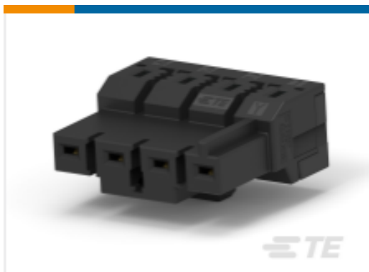
TE 产品编号2-2331743-1 D3950 REC 4POS 1ROW Y KEY