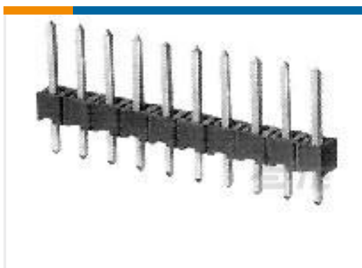
TE 产品编号826936-9 9P MOD2 STIFT LEI