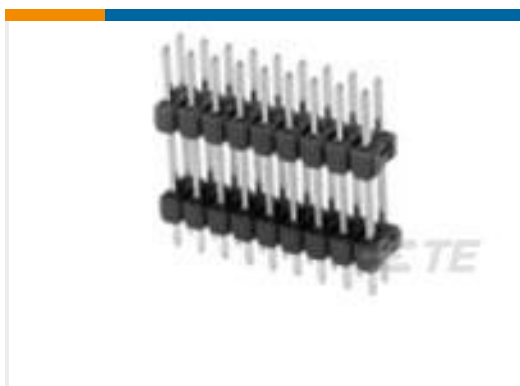
TE 产品编号5-146490-8 16 MODII HDR DRST UNSHRD STKG