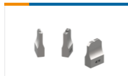
TE 产品编号2-1803395-3 ANVIL, COMBINATION, SMALL WIRE APPLICATIO