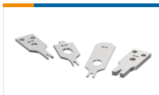
TE 产品编号2-1803143-0 CRIMPER, INSULATION O