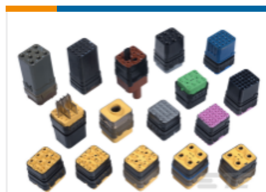
TE 产品编号ZPF000000000202094 DMC-M 0402 AW 01