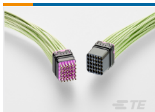
TE 产品编号ZPF000000000203398 DMC-MR 30-23 PC