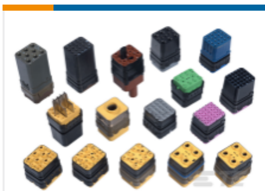
TE 产品编号ZPF000000000203708 DMC-M 99-10 PC