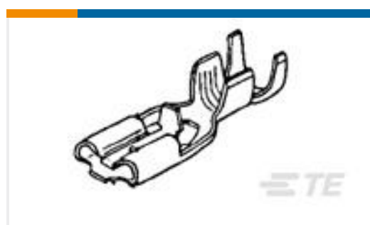
TE 产品编号170330-2 PL 187 RECEPTACLE 24-20 AWG NPPHBZ