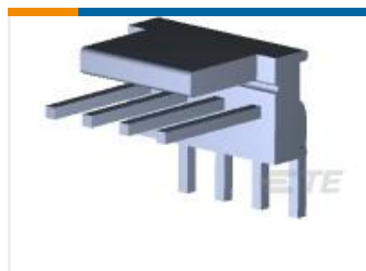
TE 产品编号640455-4 04P MTA100 HDR ASSY SQ R/A POL