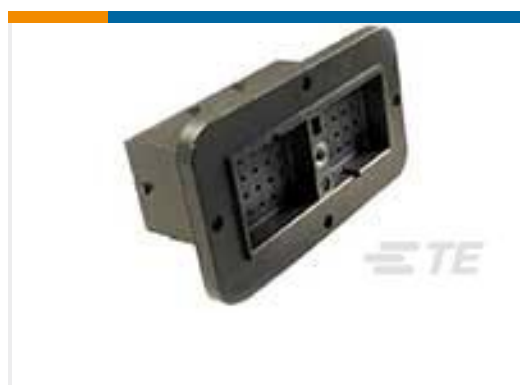
TE 产品编号DRC12-40PA REC, 40P, BLK, N, FLANGE, A