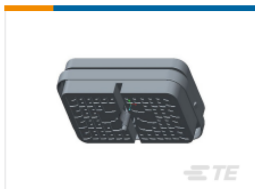
TE 产品编号DRB16-102SAE-L018 PLG, 102P, BLK, E, CAP, A