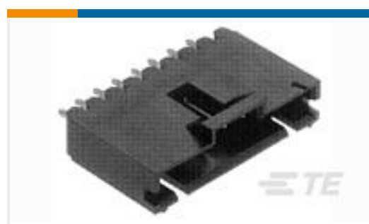
TE 产品编号103670-3 04 MTE HDR SRST LATCH W/HLDWN