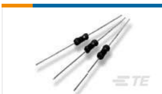
TE 产品编号6-1879352-2 RR02 5% 110R AMMO