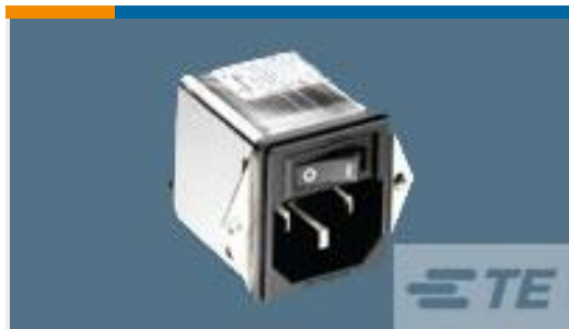
TE 产品编号2-1609114-2 1CUFF1=F8303