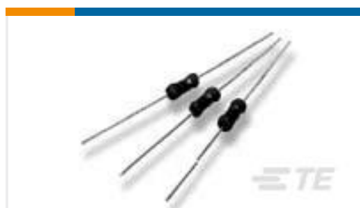
TE 产品编号9-1625892-6 3W SM M/OX 2% 1R2