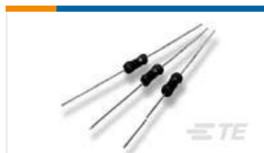
TE 产品编号7-1879350-0 RR01 5% 160R AMMO