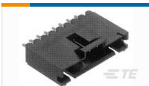
TE 产品编号2-103639-8 08 MTE HDR SRST LATCH .100CL