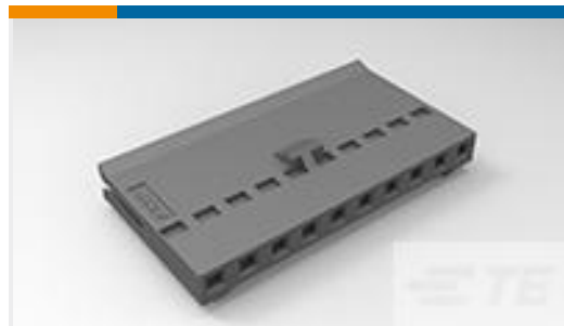
TE 产品编号2-487769-2 024 HOUSING FFC RCPT 100CL SR