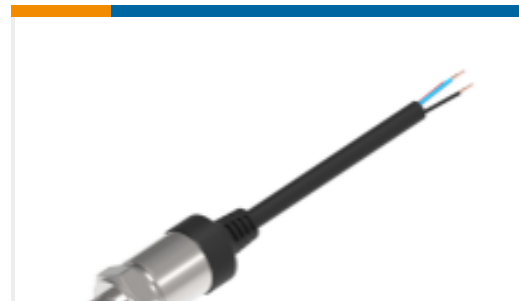
TE 产品编号20010080-00 PRESS XDCR M325M-000005-100PG