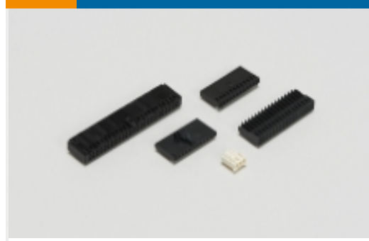
线到板连接器组件和护套(5)