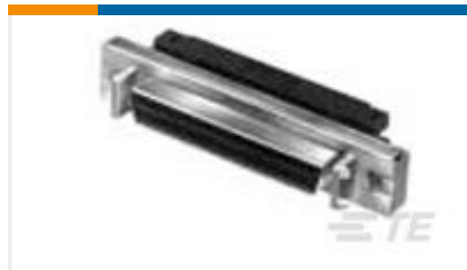
TE 产品编号749611-9 100 50SR PANEL MOUNT RCPT