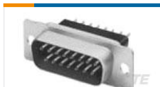
TE 产品编号205714-7 37 PLUG SP/MS STD