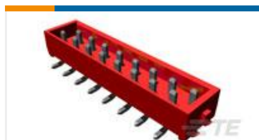
TE 产品编号8-338728-4 MICROM. MOB SMD CON