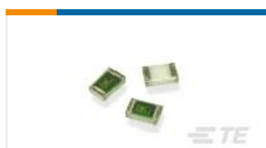
TE 产品编号3-1879134-1 RN 0603 20K5 0.1% 10PPM 1K RL