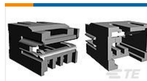
TE 产品编号1-964575-5 PCB RAHMEN 5P