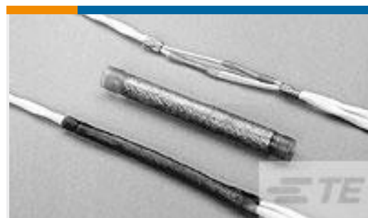
TE 产品编号608633-000 D-150-0232