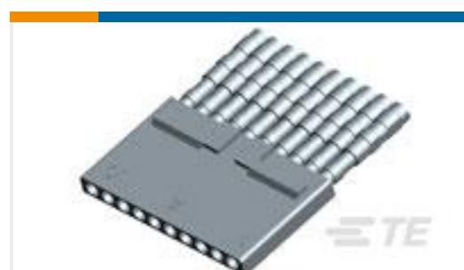
TE 产品编号697117-000 MTC100-JA1-S14