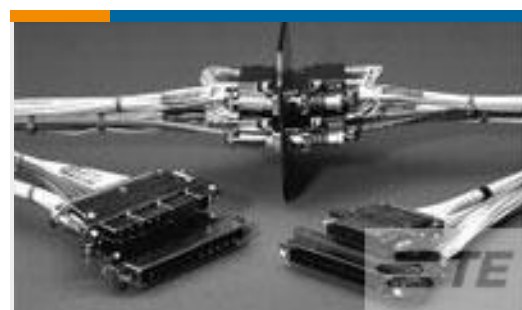
TE 产品编号699680-000 MTC100-JH1-R12