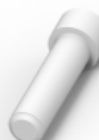
TE 产品编号114017-ZZ SEALING PLUG, SIZE 12/16, WHT