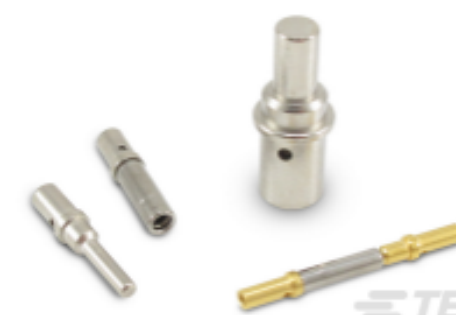
TE 产品编号0460-202-16141 DEUTSCH Solid Contacts