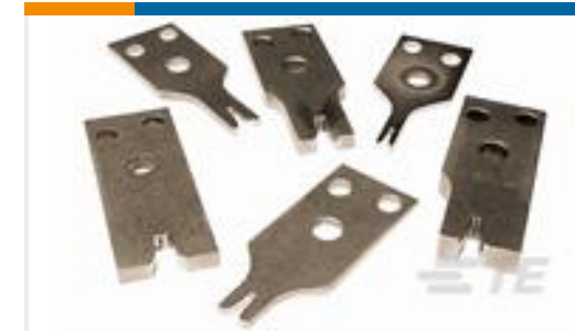
TE 产品编号8-1490019-4 CRIMPER, WIRE