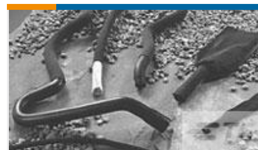
TE 产品编号CH07516001 HFT5000-34/17-0-540MM