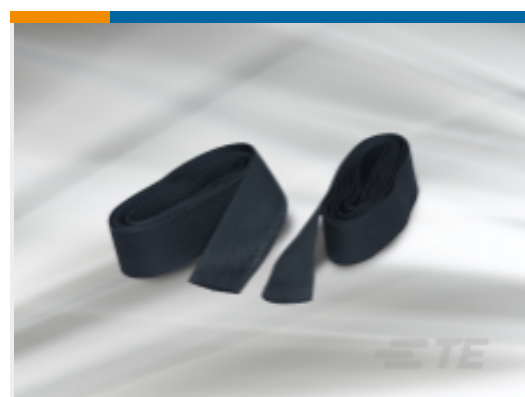
TE 产品编号6979344003 HFT5000 热缩管