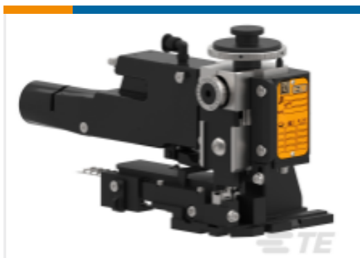
TE 产品编号2266531-2 OCEAN_2.0_Applicator-S-079F118OV