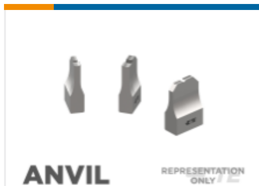
TE 产品编号6-1803054-2 ANVIL, COMBINATION