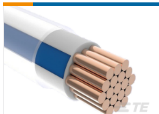
TE 产品编号CD92853001 ACW0219-0.50-76(NS)