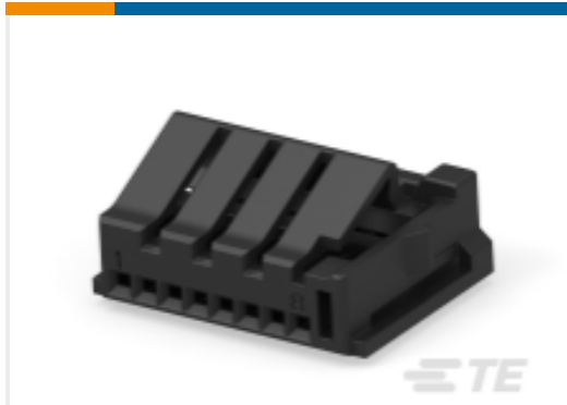
TE 产品编号1-2301969-1 8POS,PICO MQS,REC HSG,UNSLD