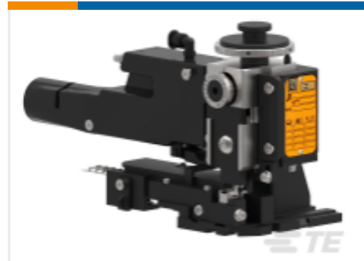
TE 产品编号2266528-2 OCEAN_2.0_APPLICATOR-S-120F126OV