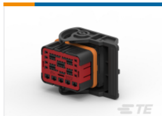
TE 产品编号6-2208775-4 53POS, MIXED,REC HSG,ASSY, SEALED