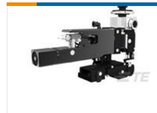
TE 产品编号2266281-2 OCEAN_2.0_Applicator-S-055F055F