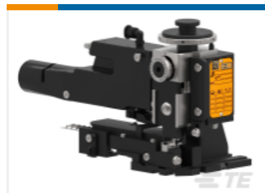
TE 产品编号2836081-2 OCEAN-2.0-APPLICATOR-S-160F180O