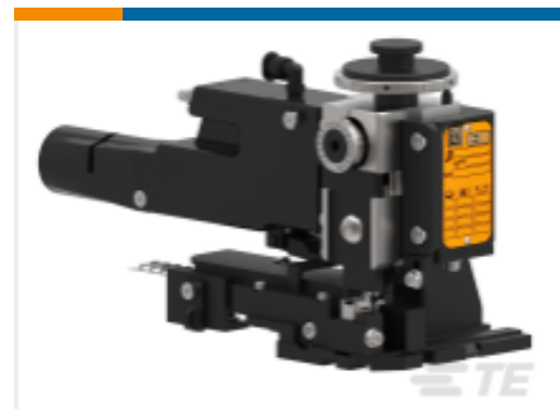
TE 产品编号2266514-2 OCEAN_2.0_Applicator-S-047F051OA