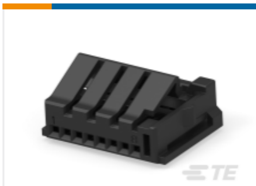
TE 产品编号1-2301969-1 8POS,PICO MQS,REC HSG,UNSLD