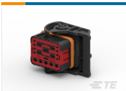
TE 产品编号6-2208775-4 53POS, MIXED,REC HSG,ASSY, SEALED