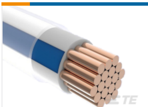
TE 产品编号CD21143001 ACW0219-2.50-12L(NS)