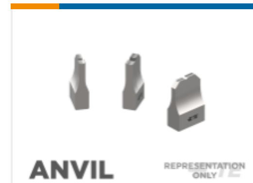
ANVIL REPRESENTATION ONLY