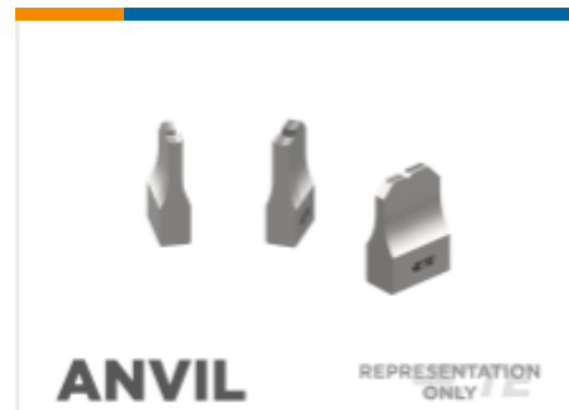
ANVIL REPRESENTATION ONLY