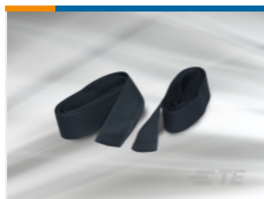
TE 产品编号6979346067 HFT5000 热缩管