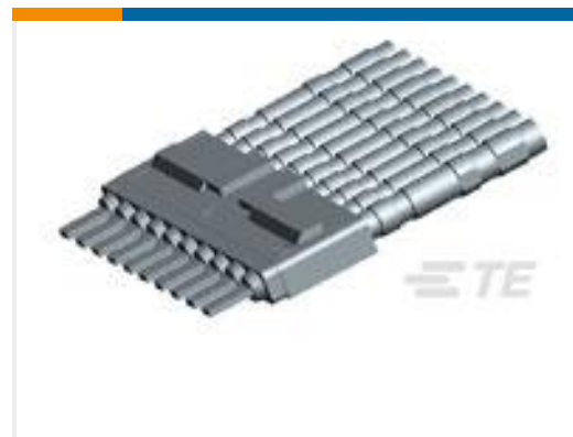
TE 产品编号697116-000 MTC100-JA1-P14