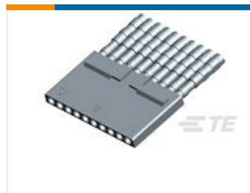
TE 产品编号697117-000 MTC100-JA1-S14