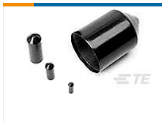
TE 产品编号843338-000 101A041-3/42-0