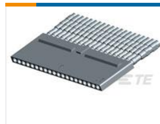
TE 产品编号697123-000 MTC100-JB2-S14