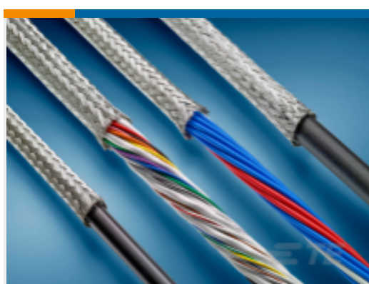
TE 产品编号D202513001 RAY-103-6.0(100)CK0380