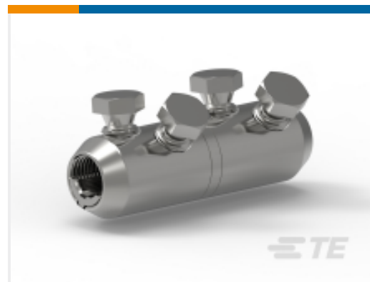
TE 产品编号1099739-1 ASBS-2-350