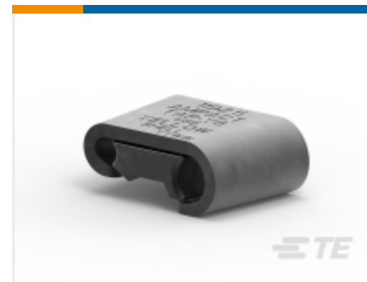
TE 产品编号1-602300-4 AMPACT 楔形压力分接连接器