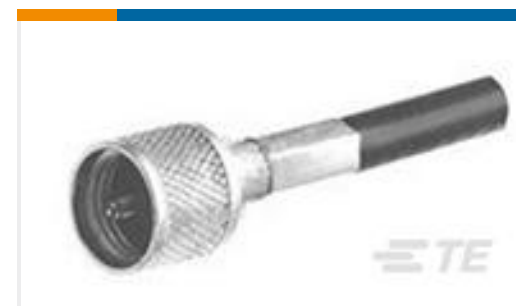
TE 产品编号330830 UHF PLUG ASSEMBLY