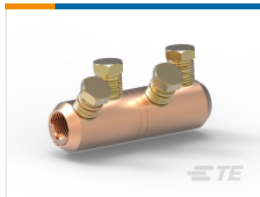
TE 产品编号1099861-1 CSBS-2/0C-500C