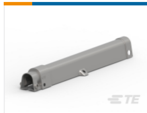
TE 产品编号BM9623-000 BCAC-G-ARM-01(B12)