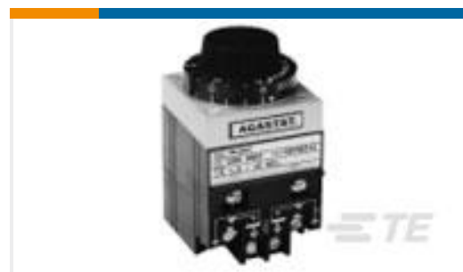
TE 产品编号2-1423159-3 7012PC=RLY,STD,ON,2P,125VDC,15