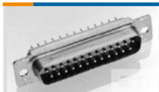
TE 产品编号205167-1 RECEPT ASSY,37 POSN,AMPLIMITE