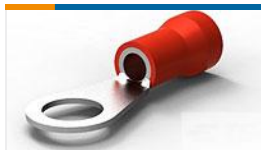
TE 产品编号52291-1 TERMINAL R PG 8 3/8