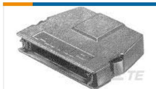
TE 产品编号5749195-2 68 50SR KIT,ST,UK