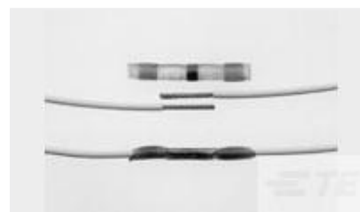
TE 产品编号F80600-000 B-152-9004