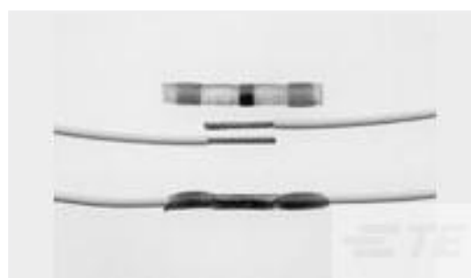
TE 产品编号D33598-000 B-152-9003