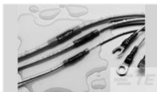
TE 产品编号108961-000 D-406-0003