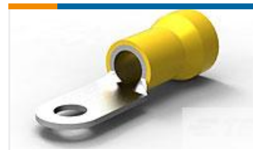
TE 产品编号52043-7 TERMINAL R PG 4 1/4