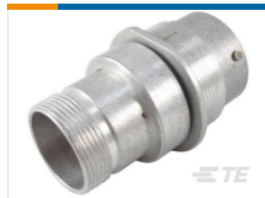
TE 产品编号HD34-24-23PN-072 REC, 23P, AL, N, THD ADPT DRAIN, 16, P