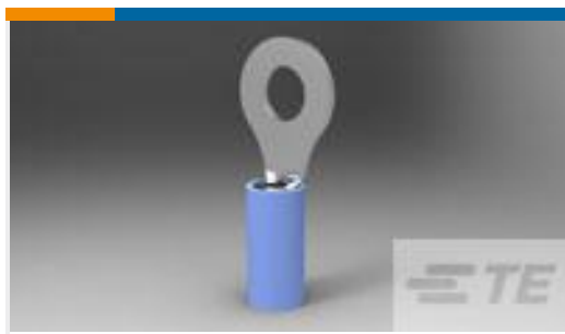
TE 产品编号2-34806-2 PIDG 16-14HD R 1/4; TAPE