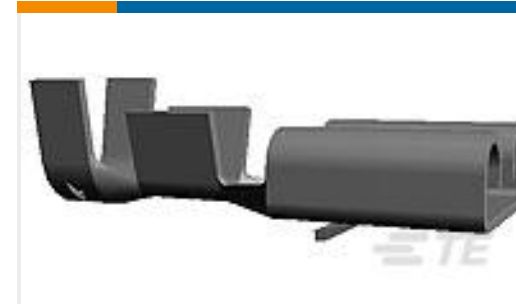
TE 产品编号42904-2 FF 250 REC TERMINAL 16-12 AWG TPBR