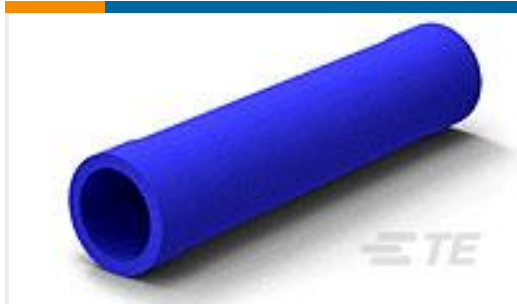
TE 产品编号2-34071-3 SPL,PG BUTT 16-14,FUNNEL ENTRY