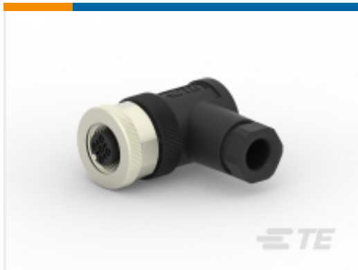
TE 产品编号T4112001041-000 M12,FEMALE,RA,A CODE,4P,PG7, GOLD