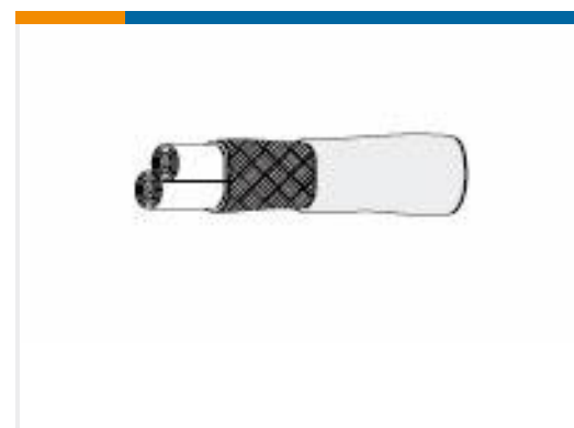
TE 产品编号331027-000 55A1111-22-6-6