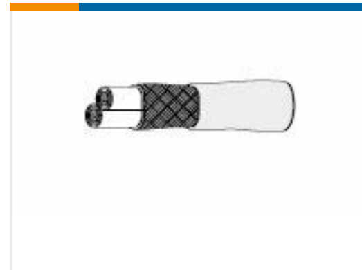
TE 产品编号316081-000 55A1121-16-6/9-9