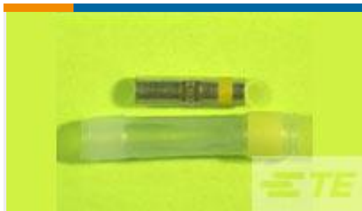
TE 产品编号 650076-000 D-436-38