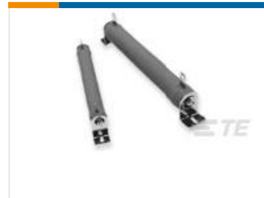
TE 产品编号1879453-1 TE 1000W 1R0 5% Bracket