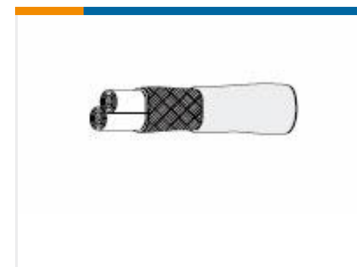
TE 产品编号917341-000 55A1122-22-9/96-9