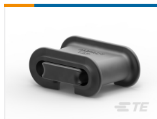
TE 产品编号 602283-4 AMPACT Al Tap 6-6,4-6