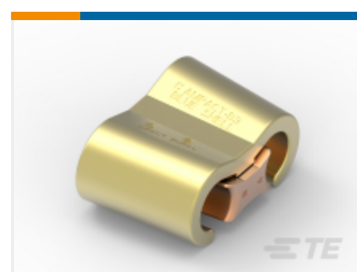
TE 产品编号 1-276337-3 AMPACT CU TAP 500-3/0