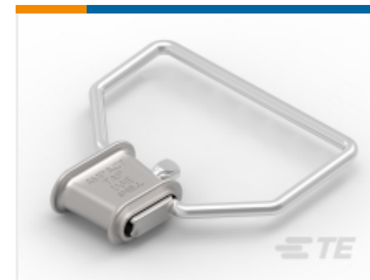
TE 产品编号 602586 STIRRUP #2 TYPE II AMPACT