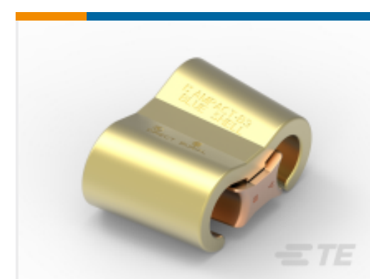
TE 产品编号 1-276337-4 AMPACT CU TAP 500-1/0