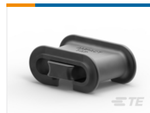
TE 产品编号 602283 AMPACT Al Tap 1/0-2