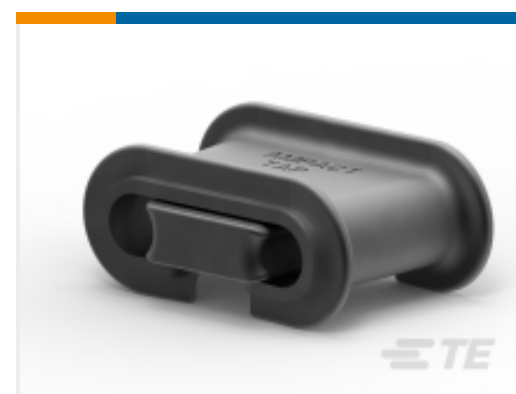
TE 产品编号 602283-2 AMPACT Al Tap 2-5,1/0-6