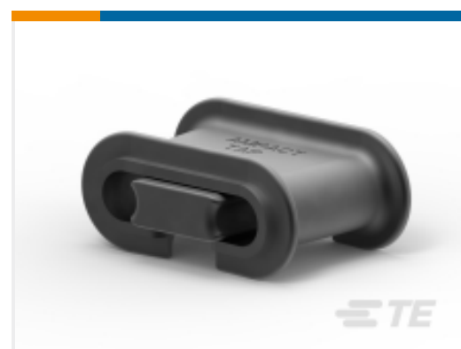
TE 产品编号 602283-3 AMPACT Al Tap 4-4,2-6