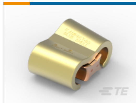
TE 产品编号 276337-8 AMPACT CU TAP 500-2