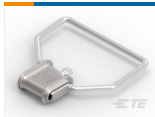
TE 产品编号 602585 STIRRUP #6 TYPE II, AMPACT