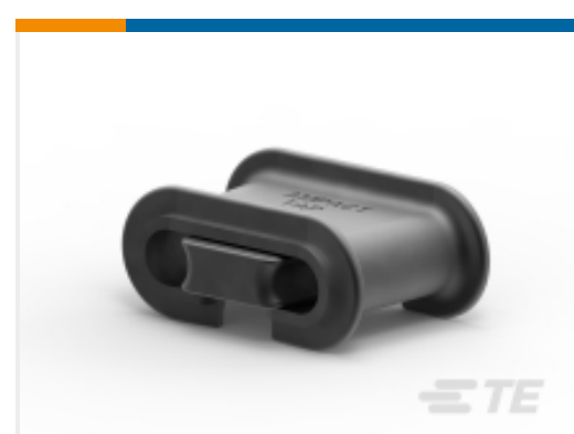
TE 产品编号 602283-1 AMPACT Al Tap 2-2,1/0-4