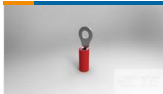
TE 产品编号51863 TERM, R, PIDG, 22-16/22-18, #6(M3.5)