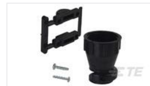
TE 产品编号206070-8 CABLE CLAMP KIT #17