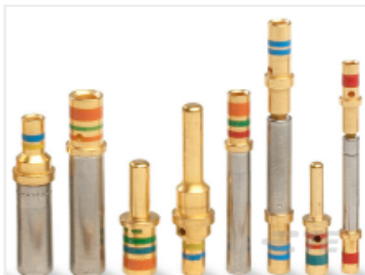
TE 产品编号 38943-22L CONT SOC ASSY