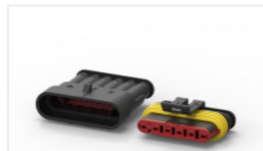
TE 产品编号CAT-AM71-CH8172 AMP SUPERSEAL 1.5MM, 连接器壳体