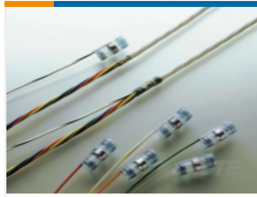
TE 产品编号575863N001 S02-17-R-3CS928