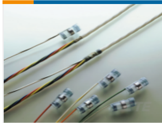
TE 产品编号365717N001 S02-20-R-4CS1093