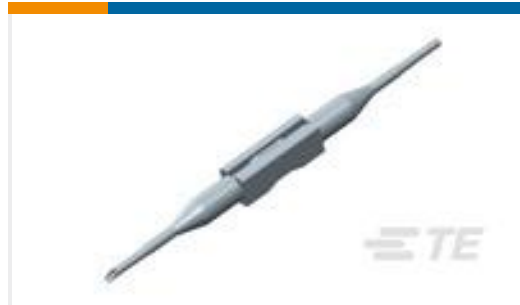
TE 产品编号110219-000 CTA-1160